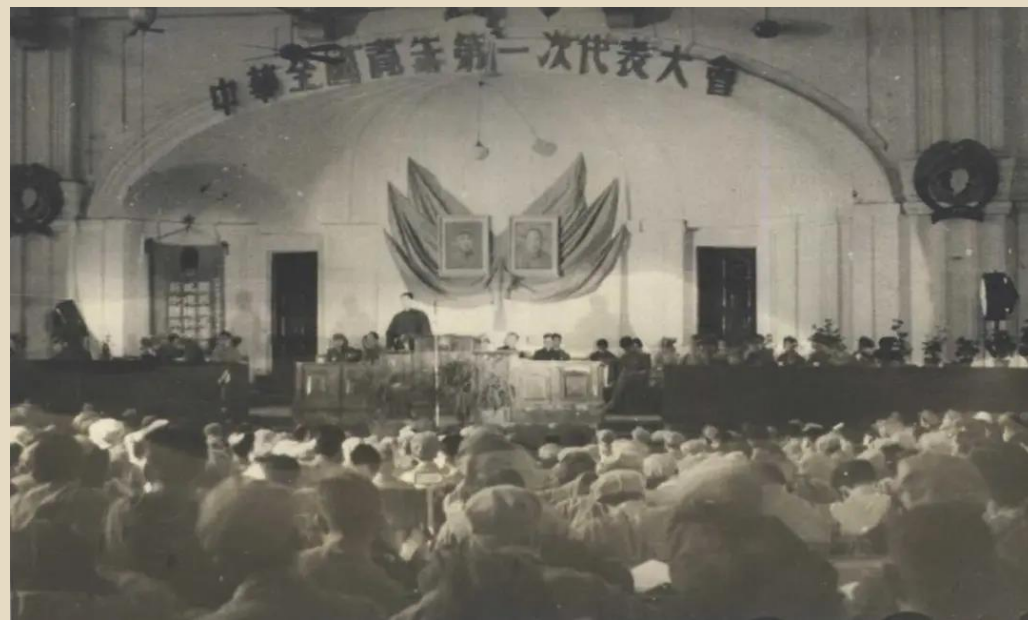
中华全国第一次青年代表大会