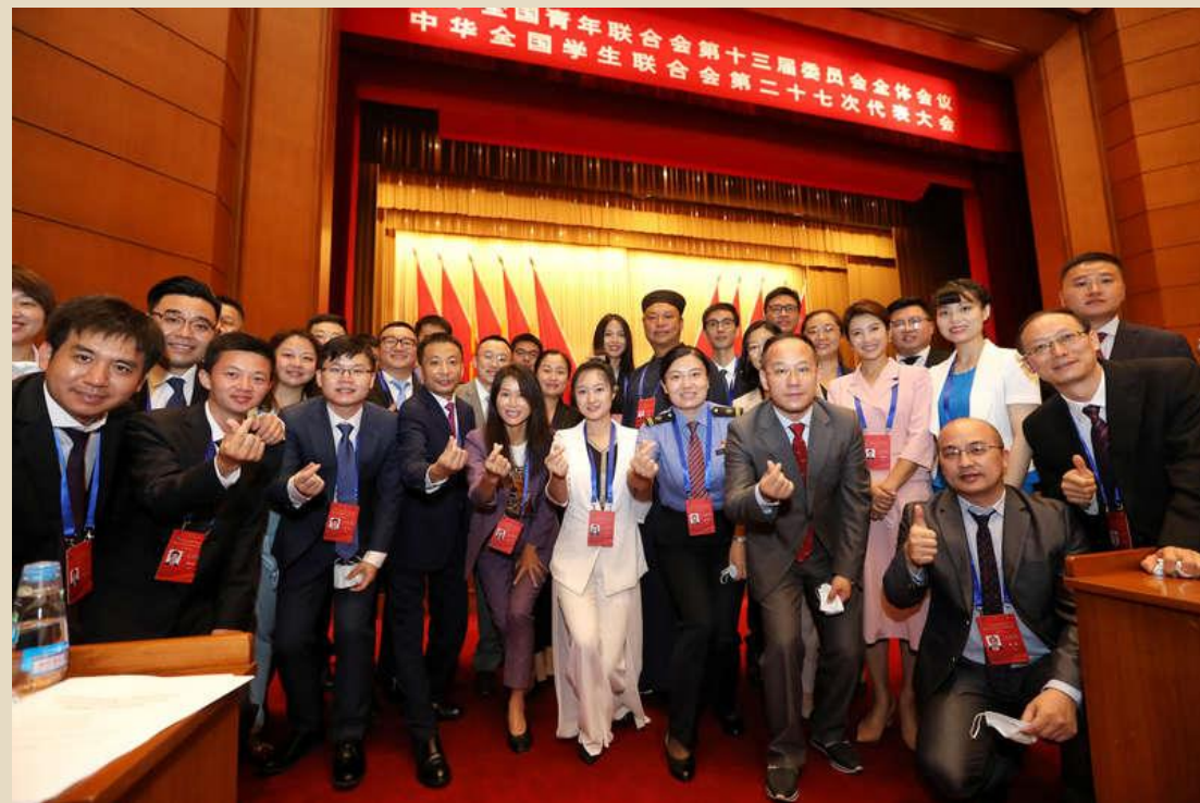
8月17日上午，中华全国青年联合会第十三届委员会全体会议、中华全国学生联合会第二十七次代表大会在京开幕。出席会议的各界青年合影留念。