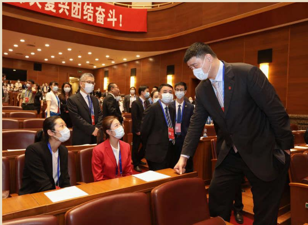
8月17日上午，中华全国青年联合会第十三届委员会全体会议、中华全国学生联合会第二十七次代表大会在京开幕。出席大会的青联委员姚明（右）与丁宁（中）、朱婷（左）交流。